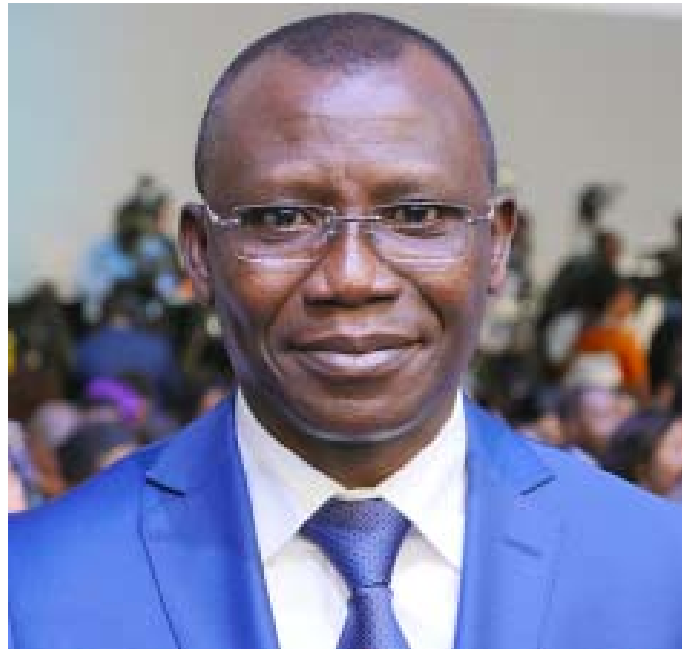
Sani Yaya, Ministre de l'Economie et des Finances

tes recouvrées, certaines ne donnent pas lieu à des encaissements effectifs ; ces dernières sont qualifiées de recettes non liquides. Constitué essentiellement des impôts, des taxes et des produits des amendes, les recettes fiscales sont collectées par le commissariat des impôts et le commissariat des douanes et des droits indirects de l'OTR. Pour une prévision annuelle de 289,97 milliards de francs Cfa, les réalisations au 31 décembre 2016 s'élèvent à 298,82 milliards de francs Cfa, soit un taux de réalisation de 103,05%. Les taxes prévues pour 284,11 milliards de francs Cfa ont été recouvrées à hauteur de 269,42 milliards, ressortant ainsi un taux de recouvrement de 94,83%. Et pour une prévision annuelle de 0,92 milliard des produits des amendes, les réali-