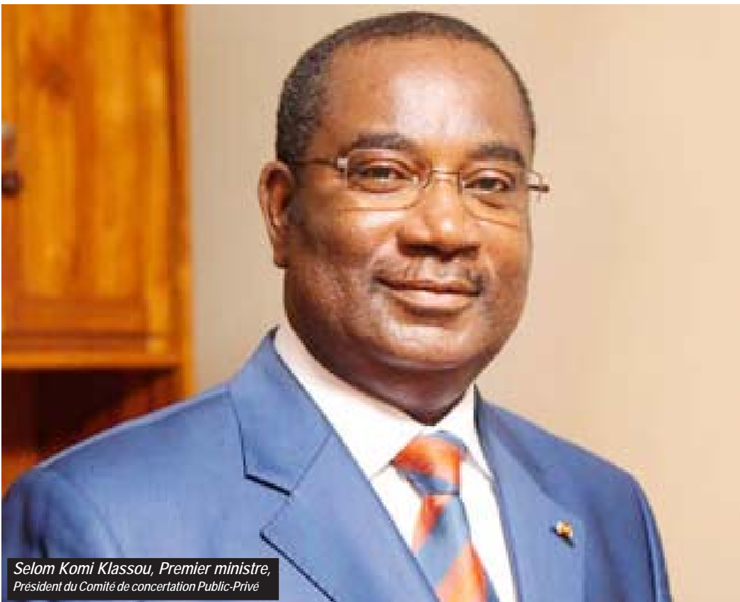
Selom Komi Klassou, Premier ministre, Président du Comité de concertation Public-Privé

* Mise en place d'un nouveau cadre de concertation entre l'Etat et le secteur privé