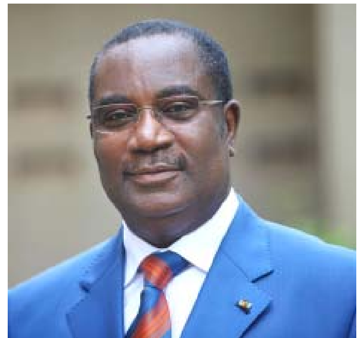
Selom Komi Klassou, Président du Comité de concertation Public-Privé

Le Comité de concertation est créé sous l'autorité du Premier