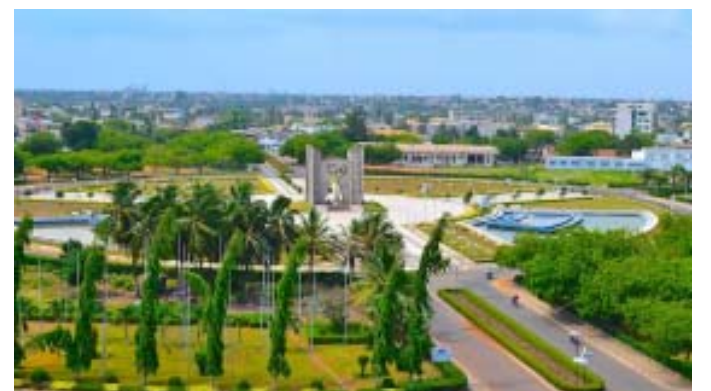
La ville de Lomé vue de la place de l'Indépendance

La conférence sera animée par des experts des villes durables is-