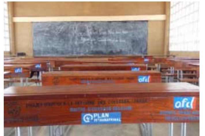
Une classe du nouveau CEG d'Agbatitoo