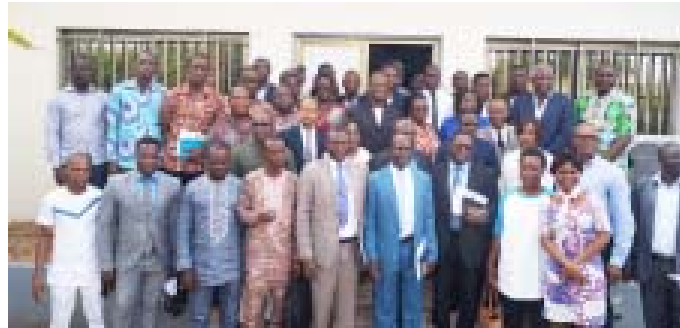
Photo de famille des participants à la fin de la cérémonie du lancement de l'Atelier

Aujourd'hui l'approvisionnement des populations en eau potable demeure l'un des soucis majeurs de l'OMS et des gouvernements. D'ailleurs la préoccupation du gouvernement togolais, à travers son ministère de l'Agriculture, de l'élevage et de l'hydraulique reste la fourniture de l'eau, en qualité et en quantité irréprochables. En plus y associer un service d'assainissement adéquat afin d'améliorer substantiellement les conditions de vie de sa population et, justement, contribuer à